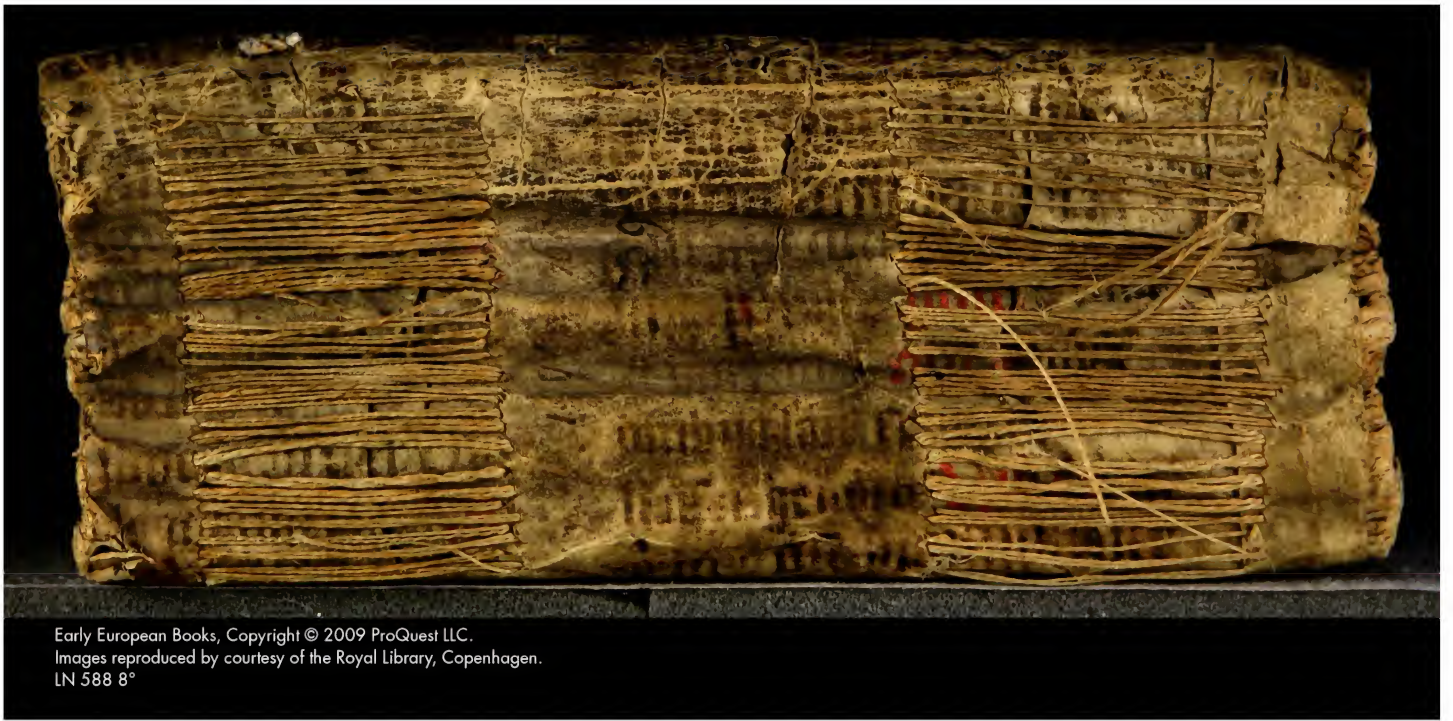
Early European Books, Copyright © 2009 ProQuest LLC. Images reproduced by courtesy of the Royal Library, Copenhagen. LN 588 8°